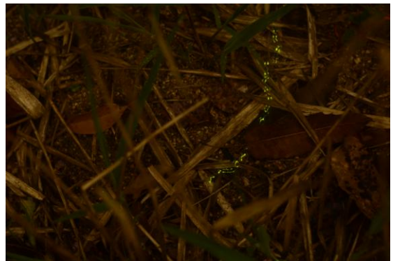
4月23日5番川原の上陸