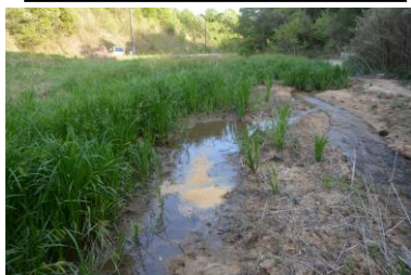
貝カワニナの餌のボカシ