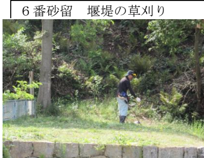
6番砂留 堰堤の草刈り