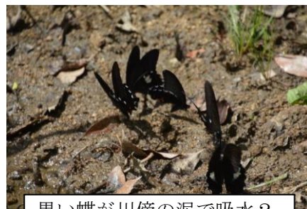
黒い蝶が川傍の泥で吸水?