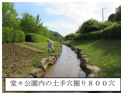
堂々公園内の土手穴掘り800穴