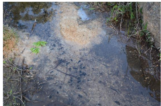
カワニナの餌になるボカシを撒く