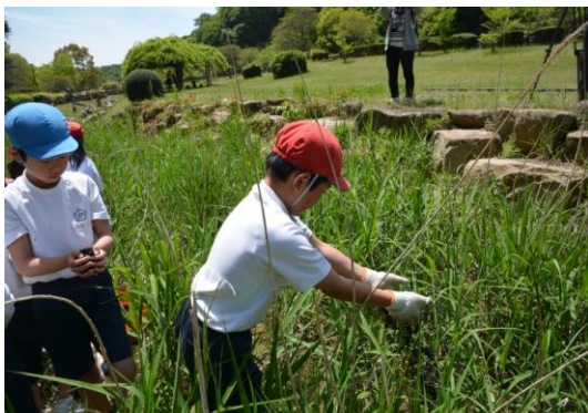
小学生と幼虫の餌になるカワニナ放流