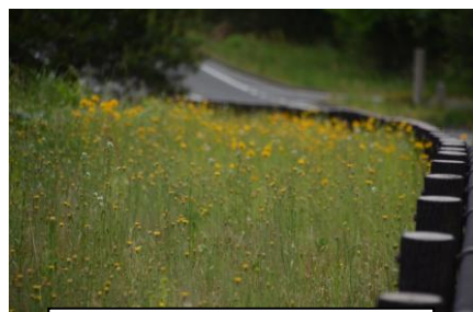
オオキンケイギクとブタナ