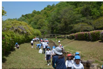
御野小球根1800球植える