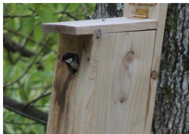
5月22日4個目の巣箱へ