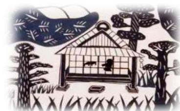
茶山ポエム「冬夜読書」