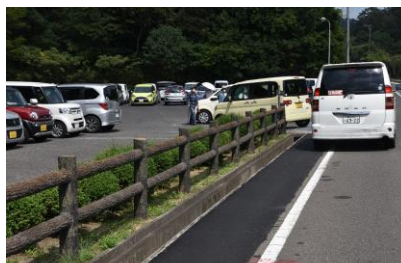
駐車場入場順番待ちが出た