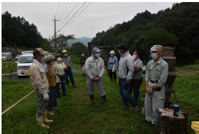
1 番砂留付近に集合 17 人