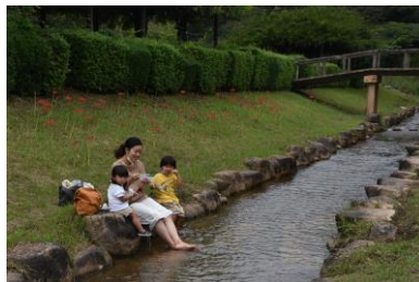
この母と子は花を守る