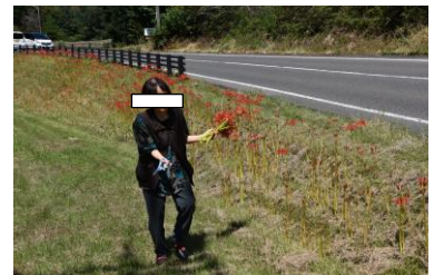
マナー知らずの婆様(旦那は車の中)