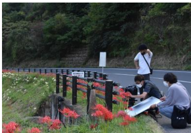
ホームテレビさん撮影中