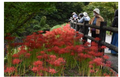
鷹が迫谷入口で歓声もあがる