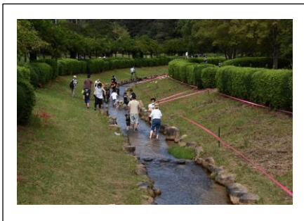
彼岸花が咲く堂々公園内小川