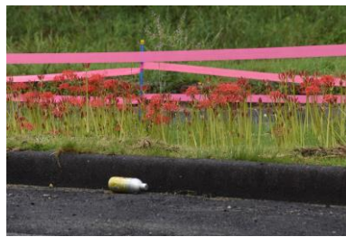
猪防御のピンクリボン設置