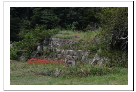
日本最古登録有形文化財1番砂留

私たちは「ホタルと花と砂留と」の活動を通して堂々川を守るボランティアです。現在の彼岸花基金の状況を報告します。現在郵便局に28万円弱預金しています。