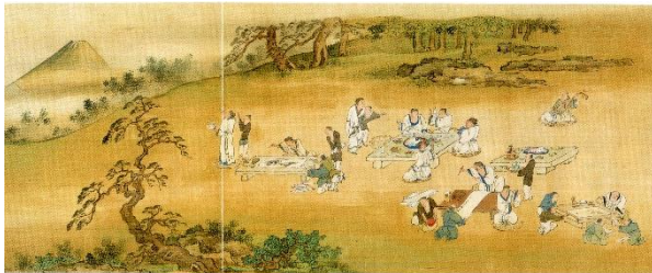
対嶽楼宴集当日真景図(部分・広島県立博物館蔵)