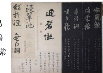
「松風館十勝」紙本墨書衝立装