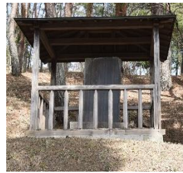
南湖十七景詩歌碑