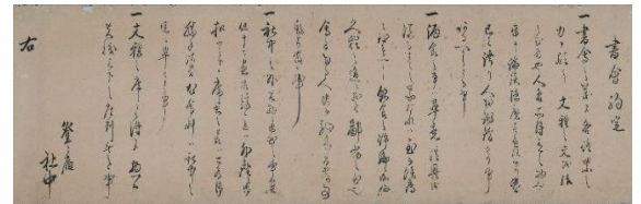
書會約定(紙本墨書扁額装)